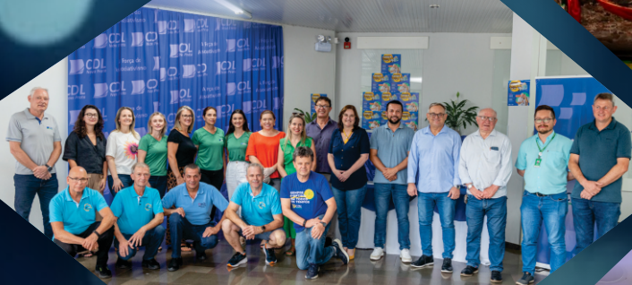
Campanha Compra Premiada