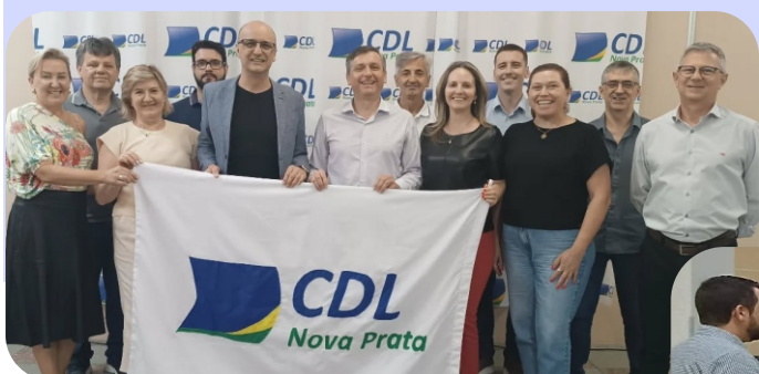
Diretoria eleita para o biênio 2026/2027

02/12/2025 – Realização da Assembleia Geral para eleição e posse da Diretoria referente ao biênio 2026/2027, momento que marcou a renovação da gestão e o fortalecimento do compromisso da entidade com seus associados e com o desenvolvimento do comércio local.