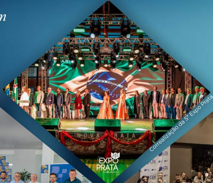
Correalização da 5ª Expo Prata

Os aprendizados e conquistas que moldaram nosso 2025!