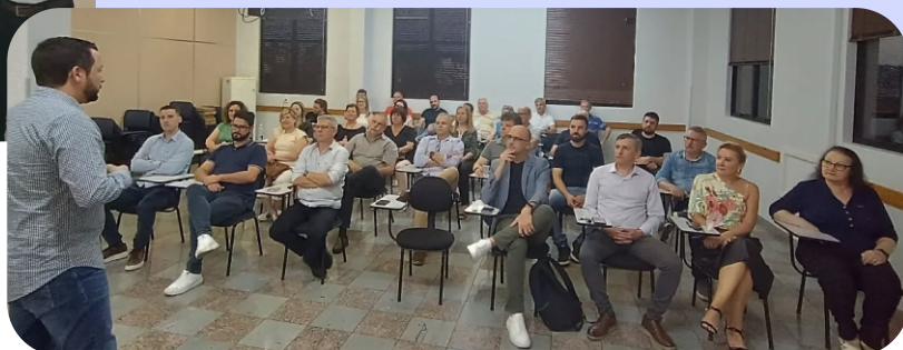
Associados e diretores participam da assembleia