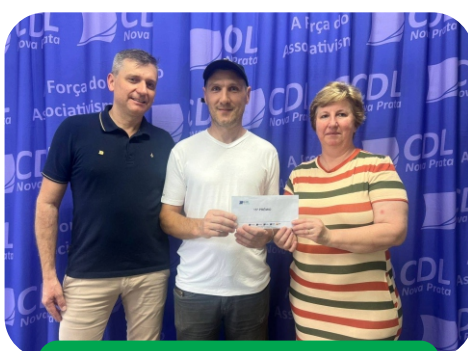
14° prêmio: Mecânica Auto Service Ltda