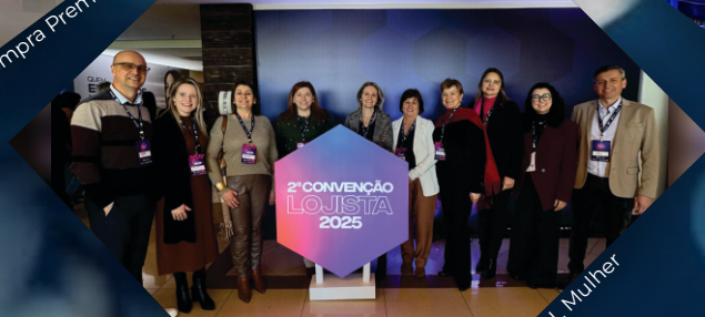
Participações da CDL e CDL Mulher

Conheça os benefícios que a CDL oferece aos associados!