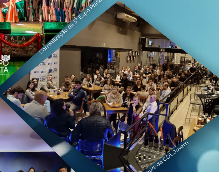
Happy Hours da CDL Jovem